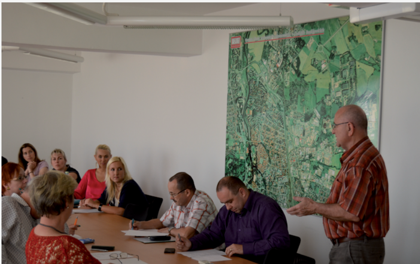
Seminář k problematice ochrany duševního vlastnictví