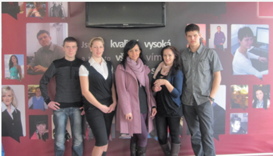
Studenti z Lotyšska