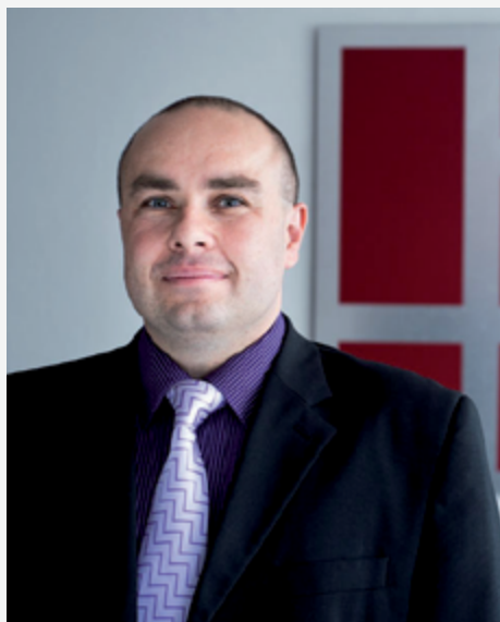
autor: Ing. Marek Vochozka, MBA, Ph.D.