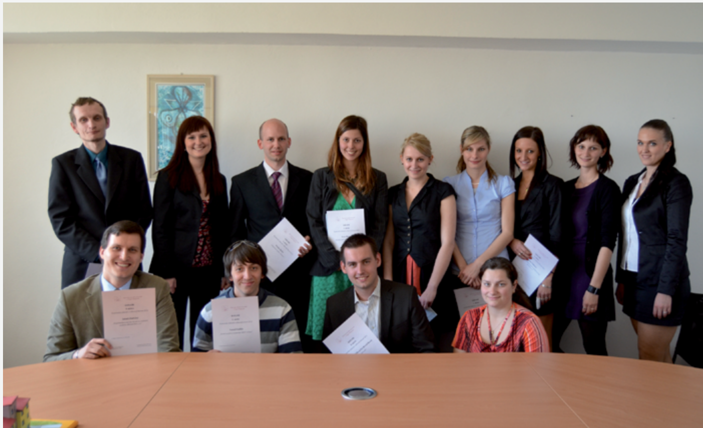
Účastníci SVOČ 2012

hodit. Nakonec vznikla spolupráce v rámci Projektového a inovačního centra, které je ale teprve na úplném začátku. Ještě malý dovětek: říkal jsem, že rád si vyzkouším téměř cokoliv. To je životní zkušenost, kterou si nesu z pracovního života. Až zpětně vidím, jak bylo dobře začít takzvaně odspodu. Je pro život a pracovní kariéru určitě dobré si alespoň na chvíli projít v rámci svého vzdělání nejrůznějšími profesemi. Získat zkušenosti, rozhled, vědět co každá pozice obnáší. To bych doporučoval i ostatním.