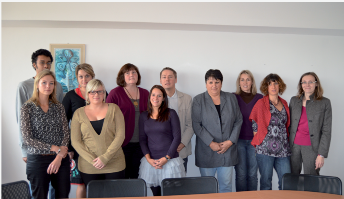
Členové katedry cizích jazyků

Velmi přínosným způsobem využití zahraničních kontaktů VŠTE se ukázaly být návštěvy vyučujících a zaměstnanců zahraničních partnerských vysokých škol, ale i dalších institucí. Návštěva zahraničního hosta skýtá vhodný prostor pro prezentaci VŠTE a předvedení jejích kvalit. Zároveň studenti i zaměstnanci VŠTE mají možnost získat nové poznatky a inspiraci, které s nimi host v rámci svého působení sdílí. Dozívají se nejen o nových tématech, ale setkávají se i s rozdílnými přístupy k výuce, administrativě. Dochází tak k rozšíření obzorů všech zúčastněných stran, které mohou být využity ke zkvalitnění jejich vlastní činnosti. V tomto článku Vám představíme několik našich hostů, kteří poctili VŠTE svou návštěvou v nedávné době.